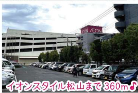
イオンスタイル松山まで360m♪